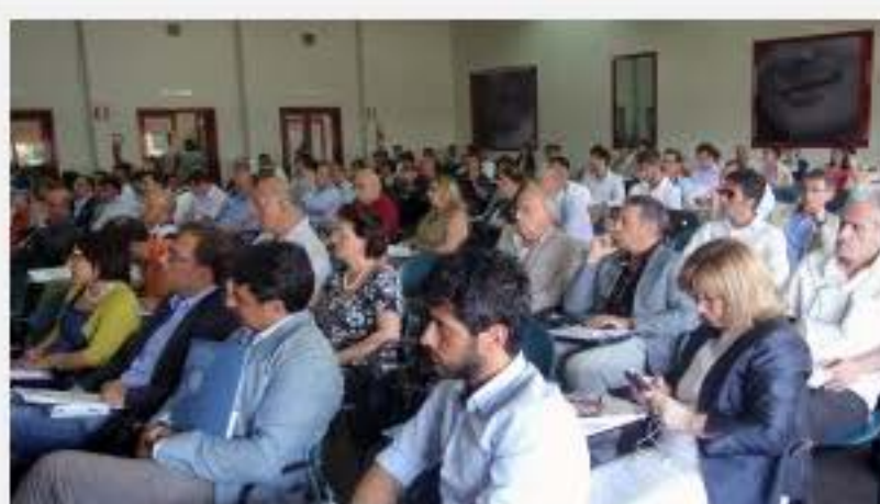
gli imprenditori in sala