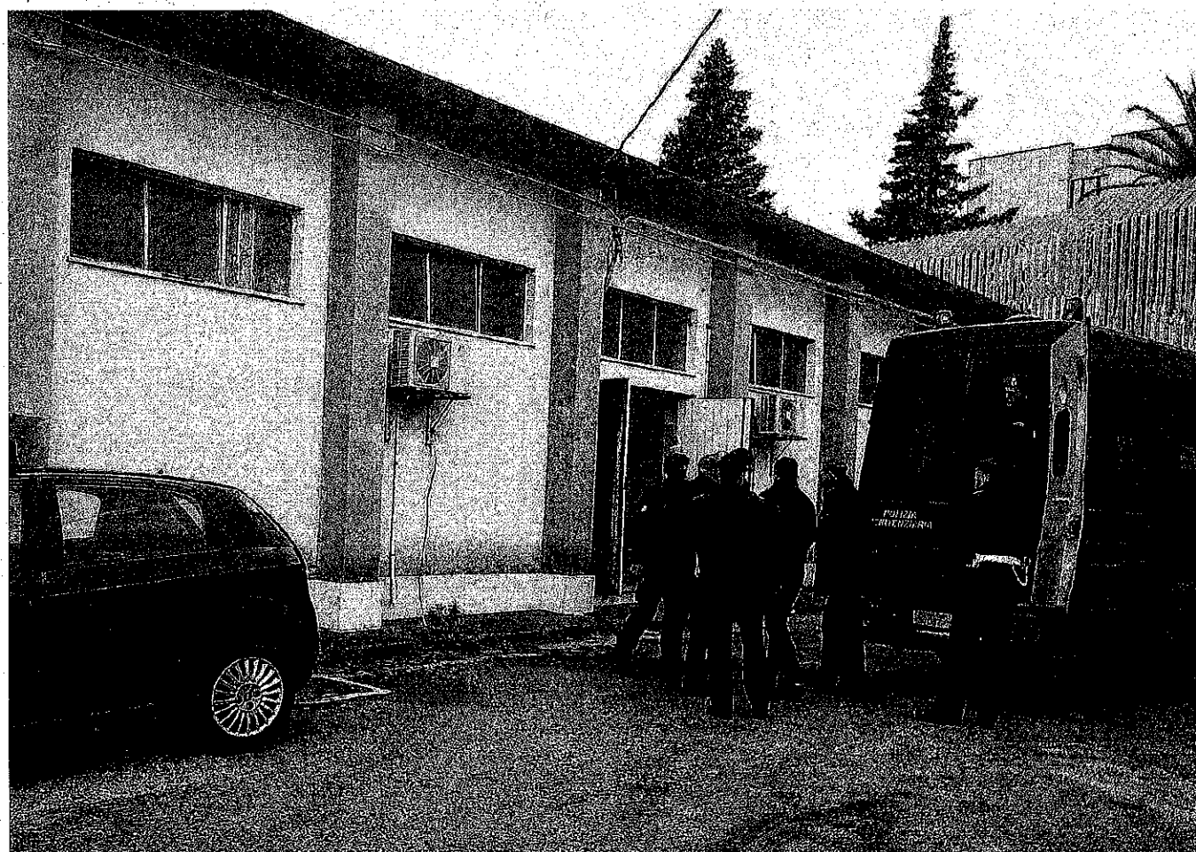
Aula bunker. Il processo d'appello al clan Giampà in corso a Catanzaro